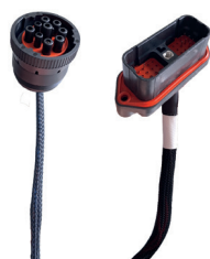
PŘÍPRAVA Z VÝROBY